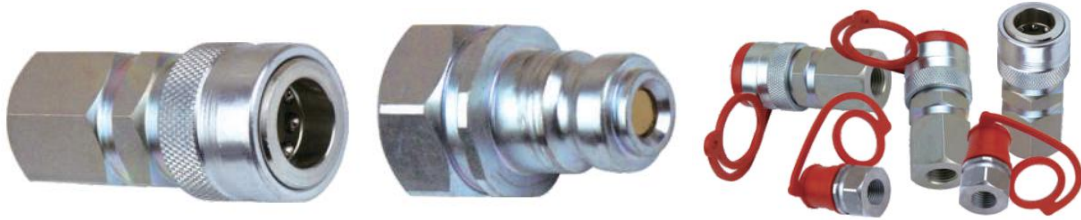
155 系列附件（公头和母头都有标准塑料防尘帽）