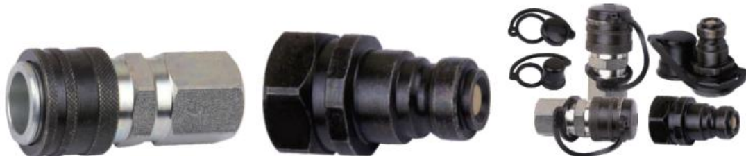
165 系列附件（公头和母头都有标准塑料防尘帽）